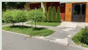
Oprava chodníkov na Juhu pri BD 1064