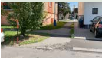
Chodník na Ulici duklianskych hrdinov

situácie, toleranciu, pretože počas opráv budú cesty čiastočne uzatvorené a doprava na nich môže byť výrazne obmedzená a zhusnená.