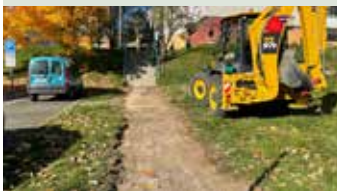
Oprava spevnenej plochy na Okulke pri BD P