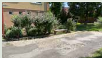
Chodník pri BD č. 1323 na Sídlišku II