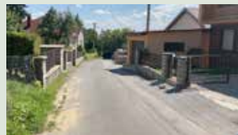
Oprava cesty a chodníka na Jarnej ulici