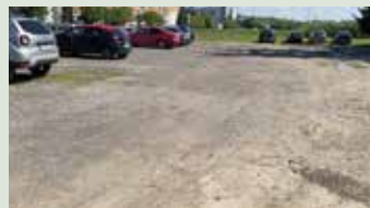
Vyštrkovanie parkoviska na Juhu pri kotolni