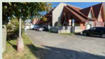
Oprava plochy za budovou DIPO