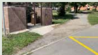
Oprava časti chodníka na Juhu pri stojisku