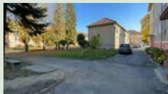
Oprava spevnenej plochy na Sídli. I pri BD 991