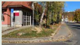
Oprava spevnenej plochy pri DIPE