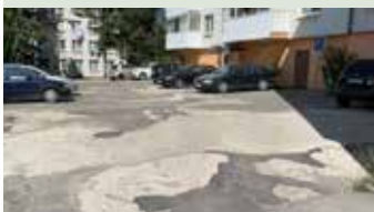
Oprava parkoviska na Sídli. 1. mája pri BD C