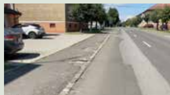
Oprava chodníka na Ulici Janka Kráľa