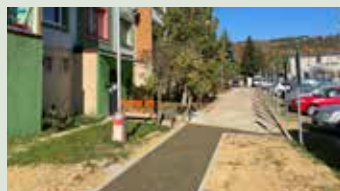
Oprava spevnenej plochy pri BD 1059