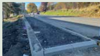
Oprava chodníka na Domašskej ulici