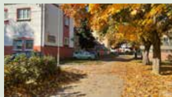
Oprava komunikácie pri BD 654 na RO