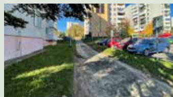
Oprava spevnenej plochy na Okulke pri BD O