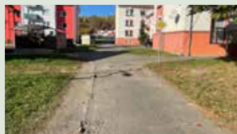
Oprava komunikácie pri BD 653 na RO