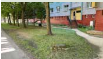
Oprava chodníkov na Juhu pri BD 1064