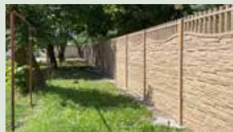
Chodník pri Základnej škole Sídliško II