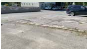
Oprava cesty a chodníka na Kalinčiakovej ulici