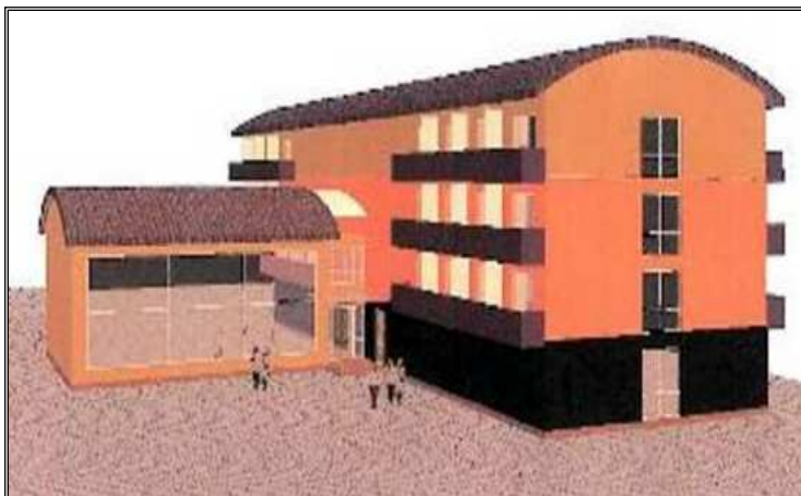
Hore: Zariadenie pre seniorov na Sídlišku 1. mája vo Vranove nad Topľou Dole: Štúdiá nového zariadenia pre seniorov.