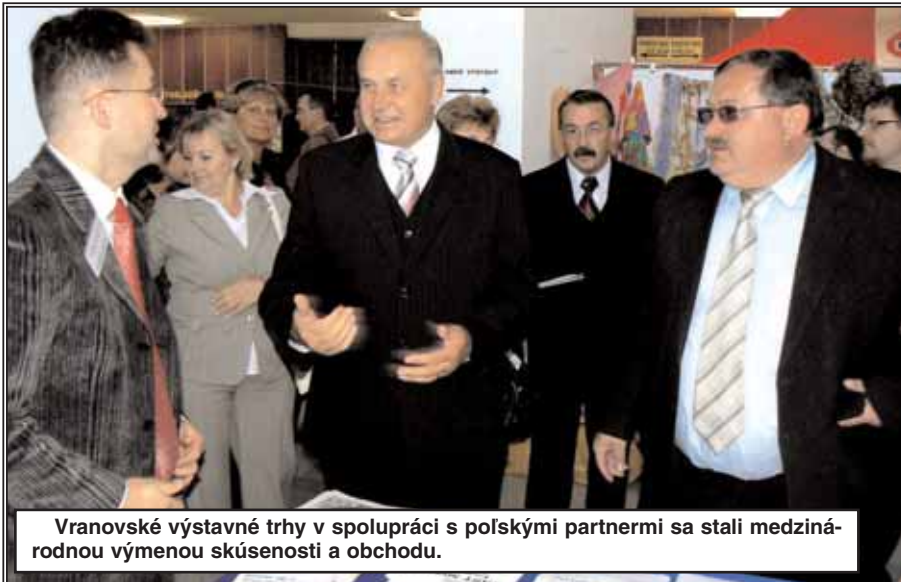
Vranovské výstavné trhy v spolupráci s poľskými partnermi sa stali medzinárodnou výmenou skúseností a obchodu.

Rady je najmä zabezpečovať a realizovať komunikáciu na úrovni vlády, VÚC a miestnej samosprávy, vytvárať pozitívne podnikateľské prostredie na miestnej úrovni, podporovať regionálny rozvoj prostredníctvom projektov cez štrukturálne fondy Európskej únie a zabezpečovať podnikateľskú podporu ekonomického rozvoja mesta.