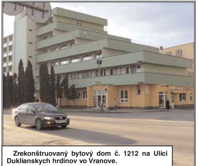
Zrekonštruovaný bytový dom č. 1212 na Ulici Duklianskych hrdinov vo Vranove.

Odfahčenie dopravy v centre mesta vrátane výstavby parkovísk a preložky VN a NN sietí. Jedná sa o úpravu komunikácie za Obvodným úradom , kde sa v roku 2007 zrealizovali preložky VN a NN sietí a výstavba trafostanice, verejné osvetlenie, povrchové odvodnenie, parkoviská v počte 93, chodníky a pre- - pokračovanie na 2. strane-