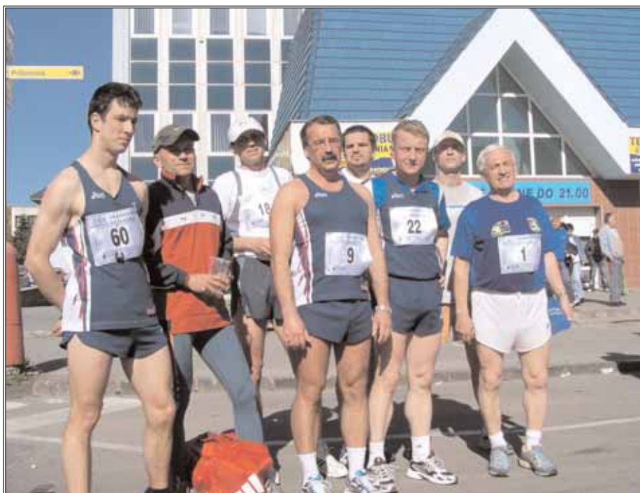
V atletickom športovom programe nahradila Zemplínsky maratón Vranovská desiatka.