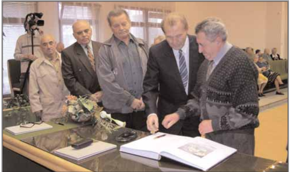
Pravidelne každý rok sa uskutočňuje aj stretnutie predstaviteľov mesta so 70-ročnými občanmi.

V roku 2007 mesto zabezpečovalo aj komunitnú sociálnu prácu a to pôsobením priamo v teréne prostredníctvom jedného komunitného sociálneho pracovníka a dvoch asistentov, ktorí sa v problémových rodinách zameriavali na záškoláctvo, spolužitie, spolupôsobenie pri zabezpečení povinného očkovania detí, hygienických návykov ap. predovšetkým pre rómske komunity. Vzhľadom na aktuálnu potrebu mesto uvažuje s touto terénnou prácou pokračovať aj v roku 2008.